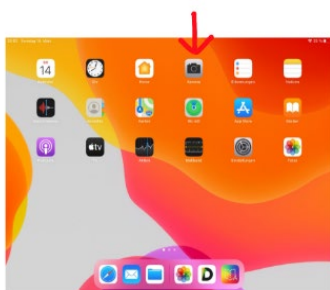
App zum Fotos machen

Unter dem Button könnt ihr einstellen, ob ihr ein Fotomachen wollt oder ein Video drehen möchtet.